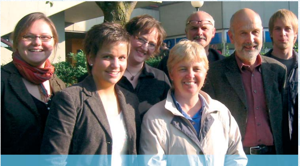
Die Studienberater der Universität Paderborn

Di, Do: 9.00–11.00 Uhr; Do: 13.00–15.00 Uhr; Mi: 16.00–18.00 Uhr (vorzugsweise für Berufstätige) sowie nach Vereinbarung.