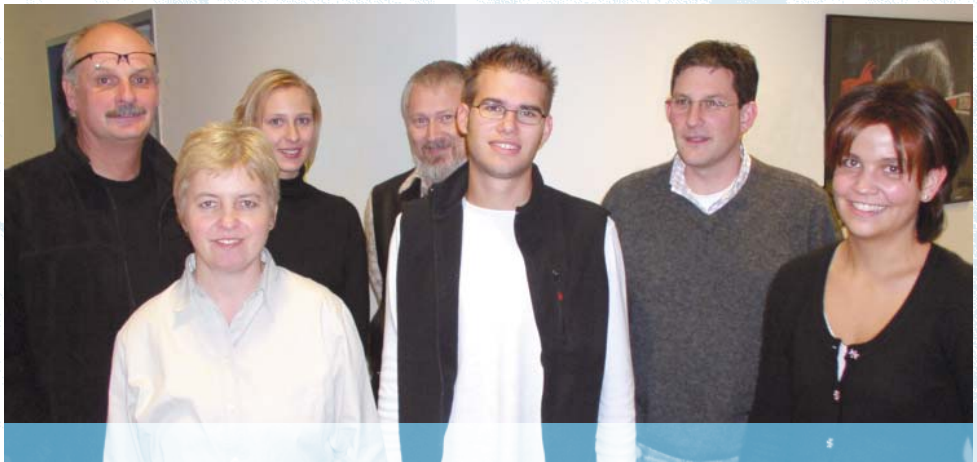
Die Studienberater der Universität Paderborn

Di, Do: 9.00–11.00 Uhr; Do: 13.00–15.00 Uhr; Mi: 16.00–18.00 Uhr (vorzugsweise für Berufstätige) sowie nach Vereinbarung.