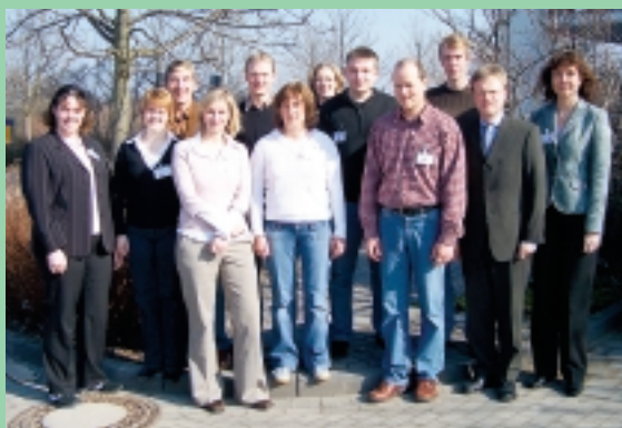
Die Teilnehmerinnen und Teilnehmer der „business update“ 2006 mit Vertretern der Veranstalter.