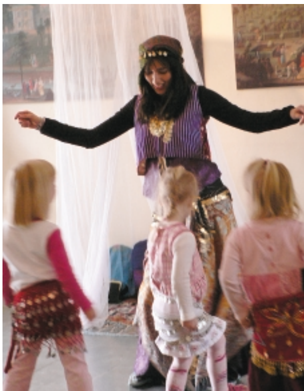
Die Kinder waren von der Bauchtanzlehrstunde begeistert.