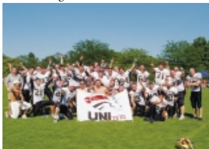
Die Unicorns wurden wieder Deutscher Hochschulmeister.

An einem Wochenende im Juli fanden in Mannheim die 17. Deutschen Hochschulmeisterschaften im American Football statt. Am Samstag wurden in zwei Gruppen die Teilnehmer für das Finale am Sonntag ermittelt. Die Unicorns aus