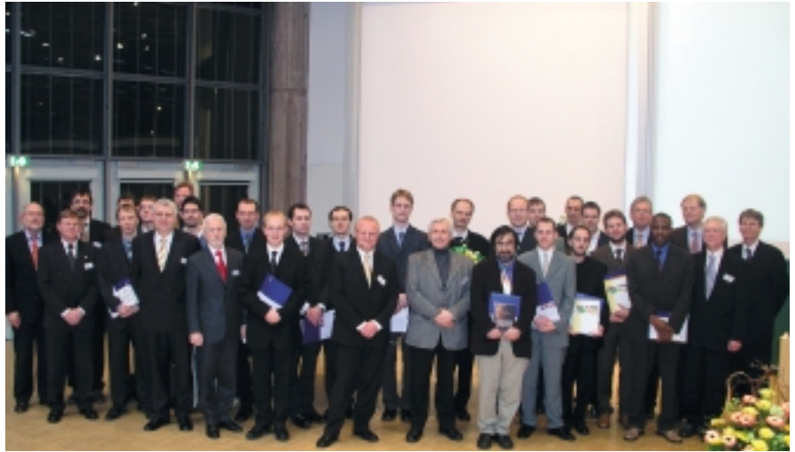
Die Preisträger mit Rektor, Dekan, Prodekanen und Vertretern der Sponsoren.