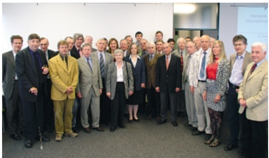
Bild: Großer Andrang herrschte bei der diesjährigen Tagung des Außenwirtschaftsausschusses des Vereins für Sozialpolitik in Paderborn.