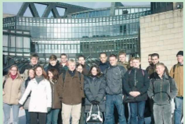
Teilnehmerinnen und Teilnehmer der Exkursion zur Geschichte Nordrhein-Westfalens.

Die aktuelle politische Stärkung des Regionalverbands Ruhrgebiet sieht der Historiker in der Kontinuität einer schon lange anhaltenden Diskussion um effizientere Verwaltungsstrukturen.