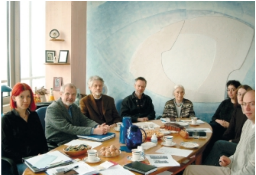
Die Initiativgruppe diskutiert über das Projekt „Sinnstiftung in der Altenpflege“

Als nächste Schritte sind eine gemeinsame Auswertung der Tagung sowie deren Dokumentation geplant. Alle Teilnehmer erklärten sich bereit, im Rahmen eines Netzwerkes gemeinsam das Projekt „Sinnstiftung in der Altenpflege“ weiter zu gestalten. Angedacht wurden weitere Mitarbeiterbefragungen in Altenwerken des Nikodemuswerkes, die Bildung einer Arbeitsgemeinschaft zur Führungskom-