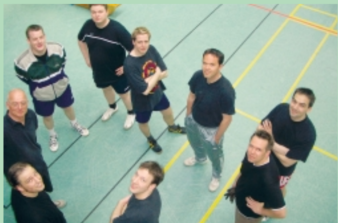
Vor dem Anpfiff: Das Siegerteam vom Lehrstuhl für „Wirtschaftsinformatik, insb. CIM“.