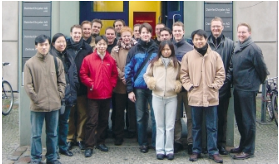
Doktoranden der International Graduate School bei der DaimlerChrysler AG.

Zweiter Schwerpunkt der Exkursion, die innerhalb des Kulturprogramms der International Graduate School durchgeführt wurde, war ein Besuch im Deutschen Bundestag. Hier führte die Pader-